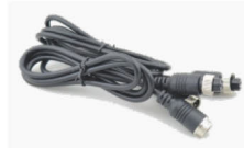
名称：防水延长接插线 规格：0.3-3米长 用途：灯具安装间距太远时的快速无损安装