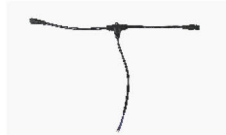
名称：防水三通接插线（五芯公/母头） 规格：信号防水对接+供电线独立引出 用途：外控灯具供电的快速无损安装