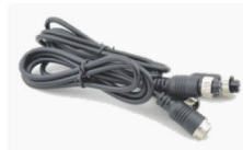
名称：防水延长接插线 规格：0.3-3米长 用途：灯具安装间距太远时的快速无损安装